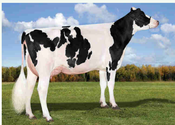
Bisnonna Cookiecutter Slim Hoplite-ET