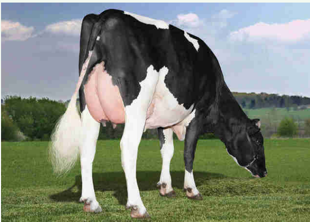
Trisnonna Endco Yoder L7933 9839-ET