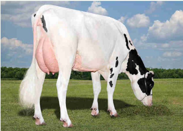
Nonna Adaway Try Me 2541-ET